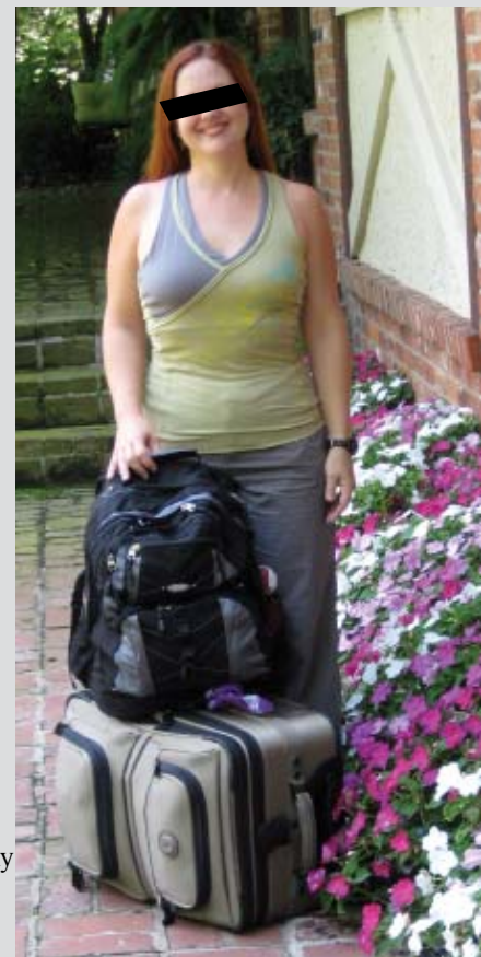
▲ Видра се вратила у род

Атеист: Не вјерујем. Будиста: Само да си ти срећна... Католик: Ја сам крив. Јевреј: Вратићу ти! Православац: Само да је наш! Агностици: Зашто немаш обојицу? Муслиман: Једна мање-више. Меланхолик: Убићу се. Колерик: Убићу те. Апатик: Добро... Песимист: Знао сам... Оптимист: Узми кључ - за сваки случај. Реалист: То је мој кофер. Наивац: Кад се враћаш? Рационалист: Немаш аргумената. Скептик: Јеси ли сигурна? Романтик: Али ја те волим! Филозоф: Зашто баш данас? Адвокат: То ће да те кошта! Банкар: То ће да ме кошта! Јапи: Колика му је плата? Либерал: Коначно слободан! Комунист: Дужан сам да те дијелим. Еколог: Иди бициклом. Клерикал: Гријешила си... Социалдемократа: Поштујем твоју одлуку Словенац: Само да није Хрват! Хрват: Само да није Словенац! Албанац: Само да није Србин! Србин: Марш у п.... материну!