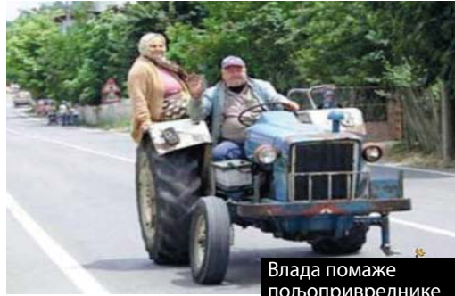
Влада помаже пољопривреднике