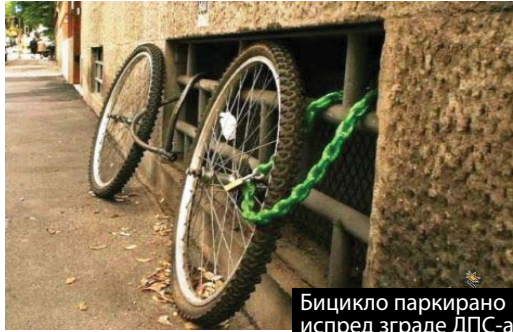
Бицикло паркирано испред зграде ДПС-а