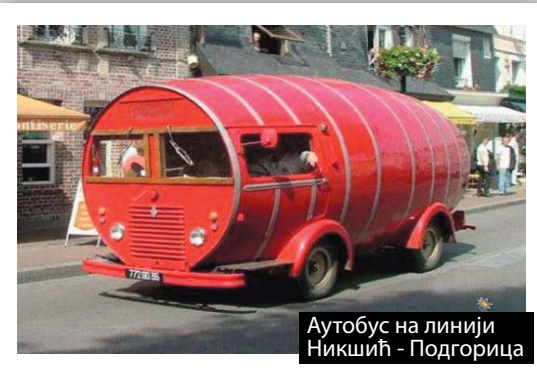
Аутобус на линији Никшић - Подгорица

Коме закон лежи у топузу, трагови му смрде ТРАНЗИЦИЈОМ